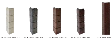
SAD80-T944 SAD80-T945 SAD80-T946 SAD80-T947 SADS-T946

SAD80：小出隅 16×80×80×455mm（内寸法） SADS：長尺出隅 16×79×79×3,030mm（内寸法） ※小出隅・長尺出隅とも各色揃えています。